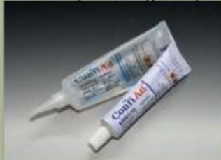
63ml Tube(Standard)(17 : 1)